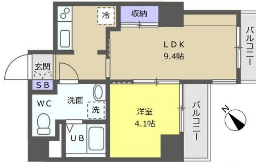
【住戸D 1LDK 32.53㎡】