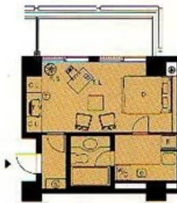
K2 TYPE.1R(K) ●3.4畳 2.3F ●キッチン 3.11㎡ ●バスルーム 2.82㎡