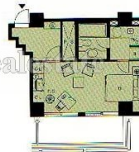
K1 TYPE.1R(K) ●3.4畳 2.3F ●キッチン 3.11㎡ ●バスルーム 2.82㎡