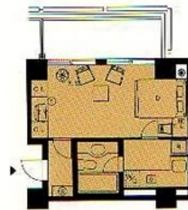
K2 TYPE.1R(K) ●3.4畳 2.3F ●キッチン 3.11㎡ ●バスルーム 2.82㎡